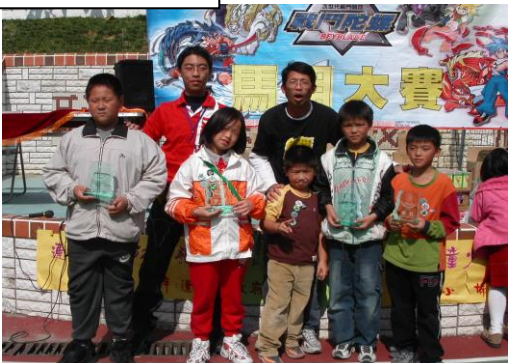
2002 馬祖戰鬥陀螺大賽，為馬祖的孩童帶來了一陣陀螺炫風，圖為當天擊敗眾多好手的陀螺戰士。