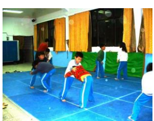
角力運動練習情形

指導老師利用晚上一、三、五時間以本校學生為主，他校學生有興趣也可一起參加，達到資源共享。