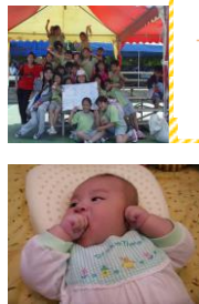
睿恩是亞鈴老師的心肝寶貝