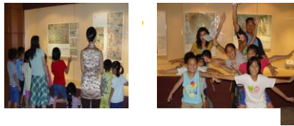
參與立仁居幼藝術展